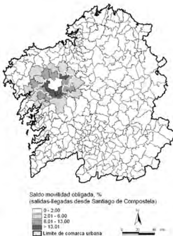
Figura 2. Saldos de movilidad obligada en Santiago de Compostela.

Aldrej Vázquez, 1999; Formigo y Aldrey, 1999) como es el caso de Ames (27,9 %) y Teo (24,8 %), y decreciendo de manera proporcional a la distancia: Oroso (19 %), Vedra (13,4 %), Boqueixón (13,4 %), Brión (12,6 %), Trazo (10,3 %), O Pino (9,71), Touro (8 %) y Val do Dubra (7,3 %). Los datos hablan de una relación funcional intensa entre el municipio de Trazo y la capital de Galicia que no consta en el área urbana compostelana de las DOT (porcentaje ligeramente superior al de O Pino, que sí se incluye). Un análisis más pormenorizado podría decidir también la incorporación de Touro y Val do Dubra que, con intensidades mucho menores a las de Trazo, tienen presencia en la vida cotidiana de Compostela. En este caso debiera advertirse que en el Avance de las DOT de 2004 sí que se incluía a Val do Dubra como municipio del área urbana de Santiago.